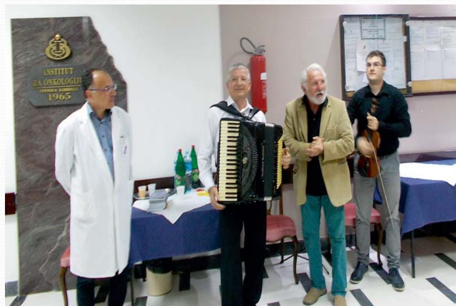
Sekcija za umetnost i kulturu i humanizaciju Srpskog lekarskog društva 'Budimo bolji od sebe'