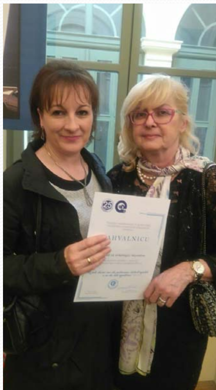
Zahvalnica IOV od Ekumenske humanitarne organizacije-uspešna saradnja u projektu Zelene dame