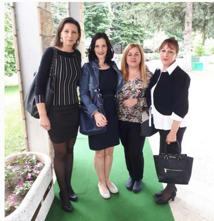
XVII Nacionalni simpozijum medicinskih sestara-tehničara i babica RS sa Međunarodnim učešćem